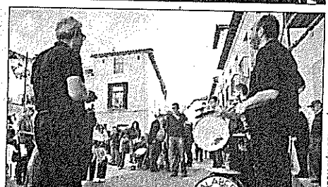
ASOCIACIÓN SERRANÍA DE GUADALAJARA Y DE ADEL SIERRA NORTE